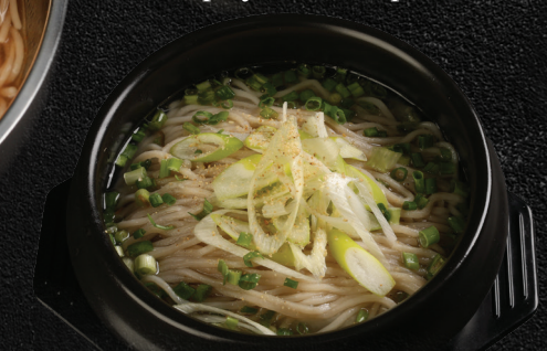
Goma Negi Shio Ramen