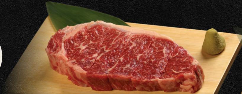
Striploin Steak 200gm

A delicassy cut for Japanese BBQ. Pre-marinated in Gyu-Kaku signature Salt Tare topped with Japanese leek and sesame seeds! Try with a squeeze of lemon!