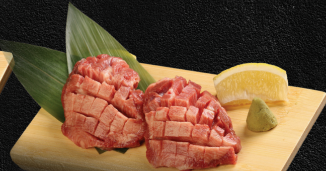
Premium Beef Tongue 90gm

أنقليس مشوي على طريقة كاباياكي | 厚切り上タン | AED 78