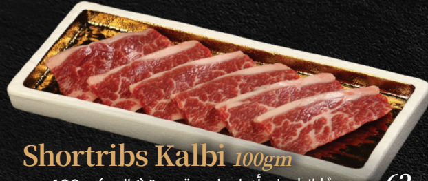
Shortribs Kalbi 100gm

أضلاع لحم قصيرة (كالبي) - 100 جم | كاربي | AED 62