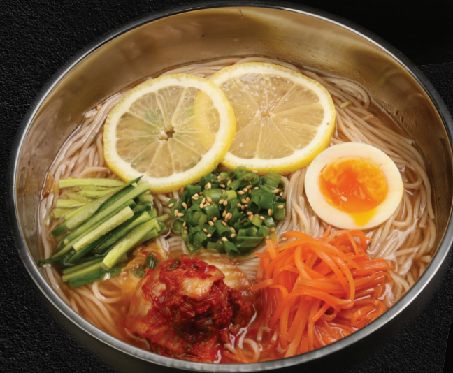
Japanese Style Cold Noodles