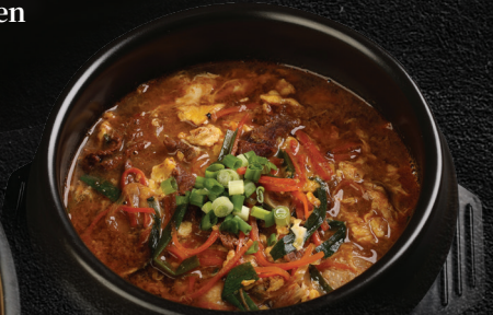
Spicy Kalbi Soup