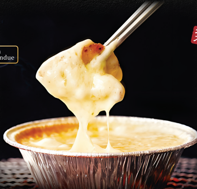
Chicken Basil with Cheese Fondue