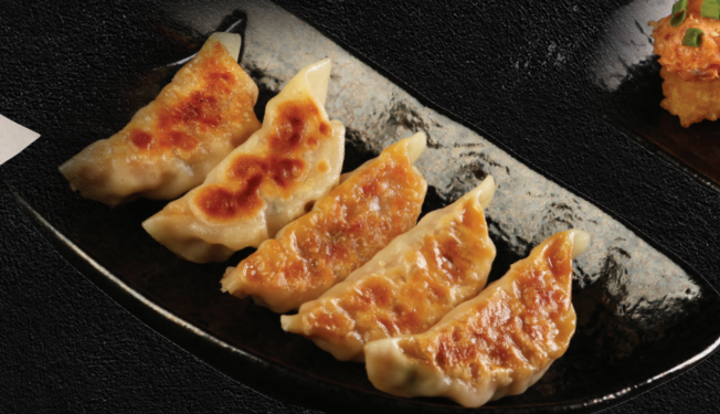
Grilled Chicken Gyoza with Wagyu Butter