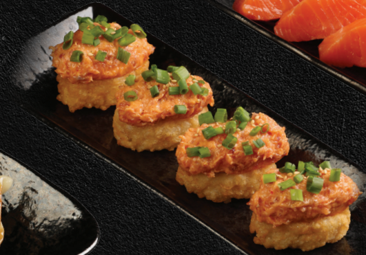
Spicy Tuna Volcano