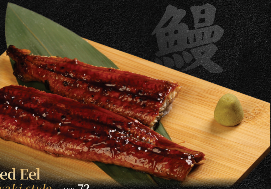
Grilled Eel Kabayaki style AED 72

鰻のかば焼き | أنقليس مشوي على طريقة كاباياكي Eel with sweet soy glaze for grilling