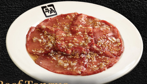
Beef Tongue 70gm