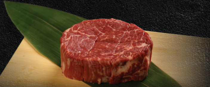
Filet Mignon 150gm