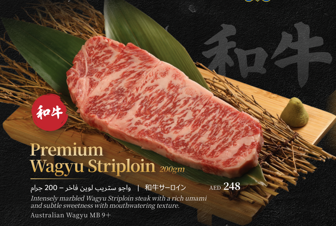
Premium Wagyu Striploin 200gm

和牛サーロイン | واجو ستريب لوين فاخر - 200 جرام Intensely marbled Wagyu Striploin steak with a rich umami and subtle sweetness with mouthwatering texture. Australian Wagyu MB 9+