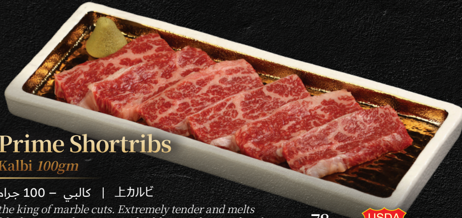
Prime Shortribs Kalbi 100gm

كالبى | 上カルビ the king of marble cuts. Extremely tender and melts like butter on the tongue. A highly prized cut with only about a 2.5% yield from the whole beef.