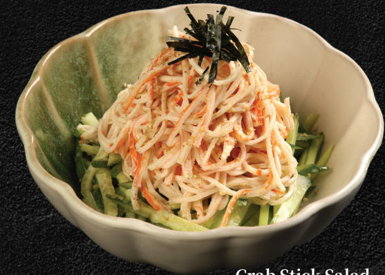
Crab Stick Salad