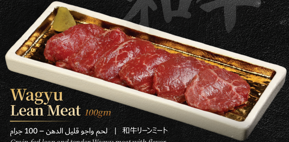
Wagyu Lean Meat 100gm

和牛リーニート | لحم واجو قليل الدهن - 100 جرام Grain-fed lean and tender Wagyu meat with flavor of red meat - our proud signature & a must try Australian Wagyu MB 4-5