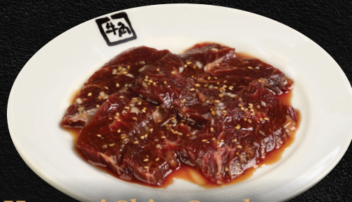
Harami Skirt Steak 100gm

Miso Marinade | Sweet Soy Tare | Salt & Pepper